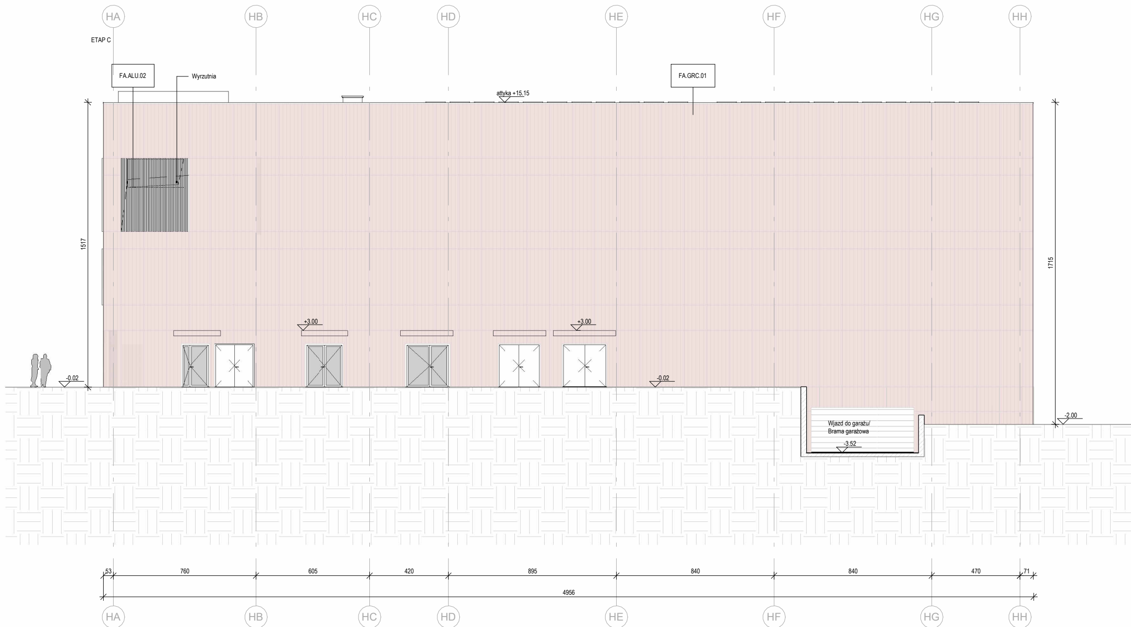
Elewacja zachodnia 1 : 200